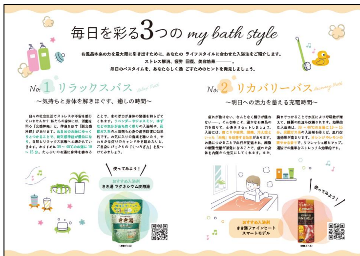
「BATH STYLE BOOK」の内容