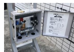
災害対応ユニット

LPガスの設備を利用し、発電や調理が可能となる設備です。移動式を含め7箇所に設置しております。これにより地震等有事の際には、率先して地域支援が可能な体制を構築しております。