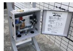
災害対応ユニット

LPガスの設備を利用し、発電や調理が可能となる設備です。移動式を含め7箇所に設置しております。これにより地震等有事の際には、率先して地域支援が可能な体制を構築しております。