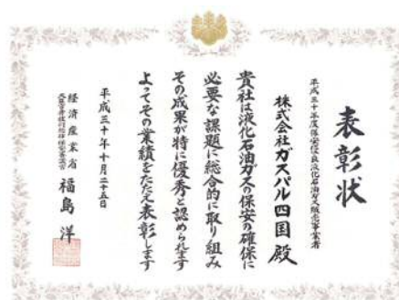
表彰状（ガスパル四国）

本表彰はLPガスの保安の高度化を図るため、自主的な保安活動を積極的に推進し、顕著な功績を挙げたLPガス販売事業者や個人・団体等を表彰するものです。